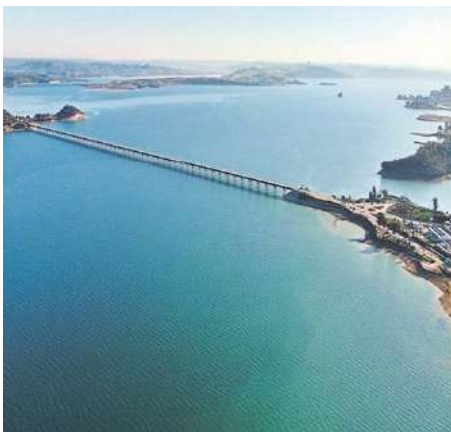
*SEYHAN BARAJ GÖLÜ