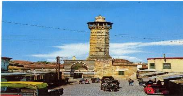
*ADANA ULU CAMİİ